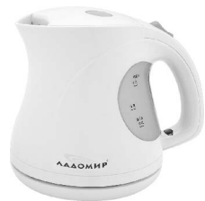
Модель "Ладомир 314"